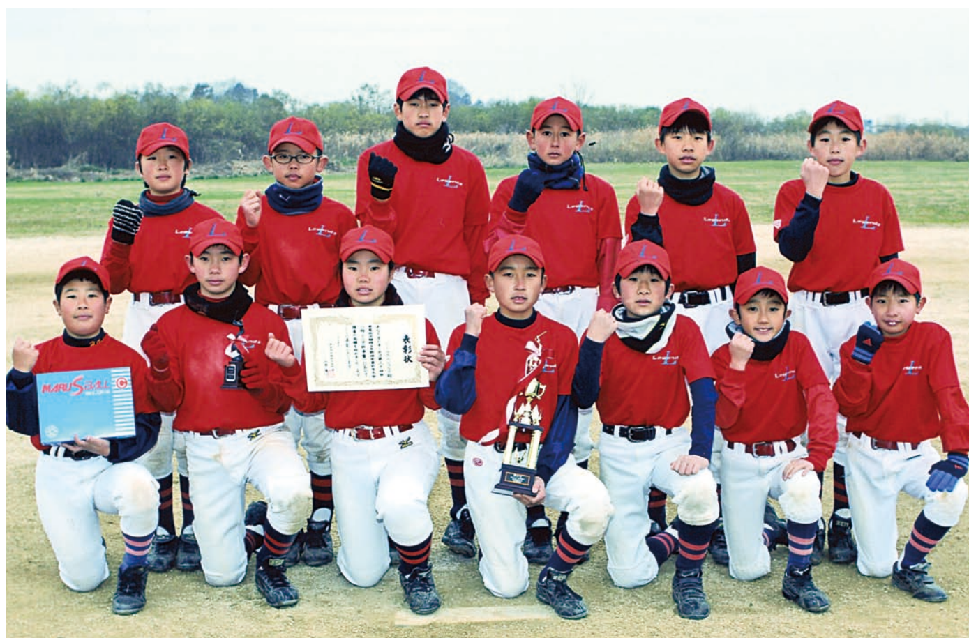
第四位 リトルレジェンス -我孫子-