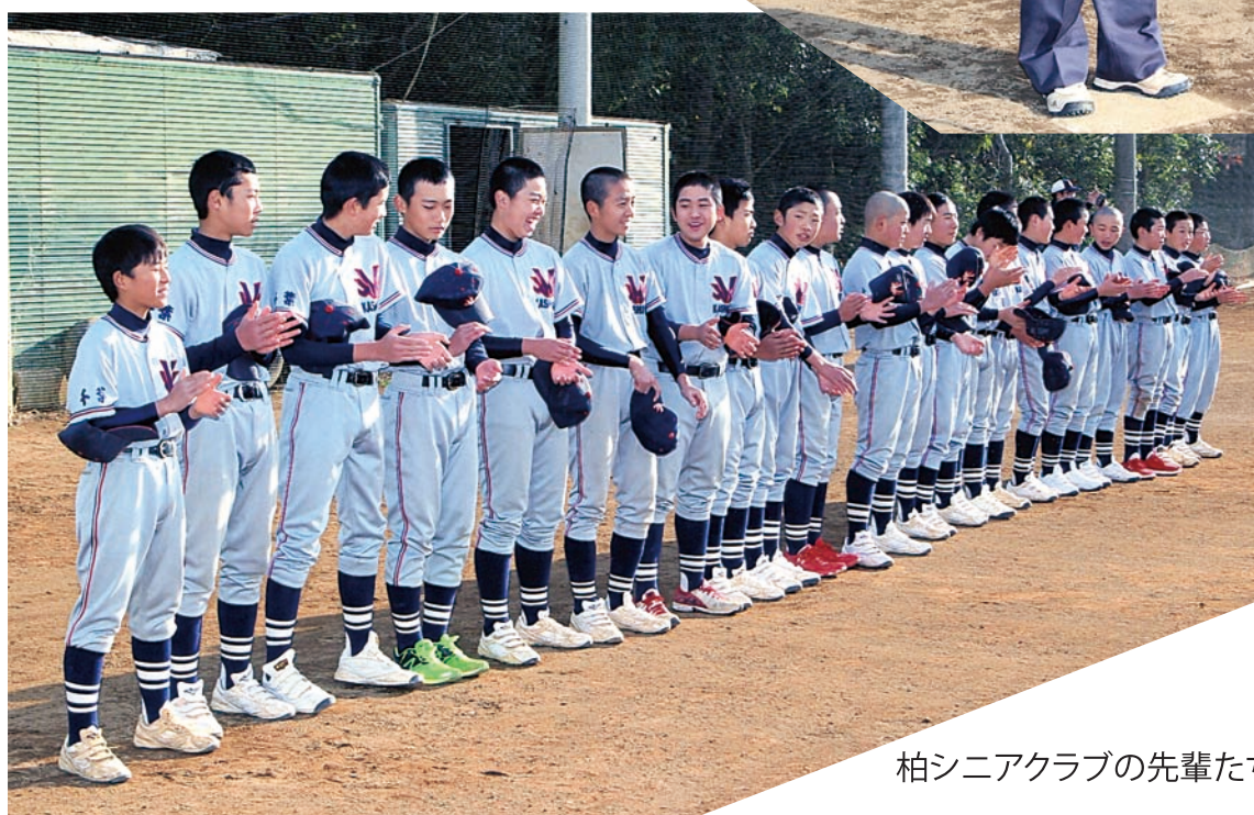
柏シニアクラブの先輩たちも揃って整列