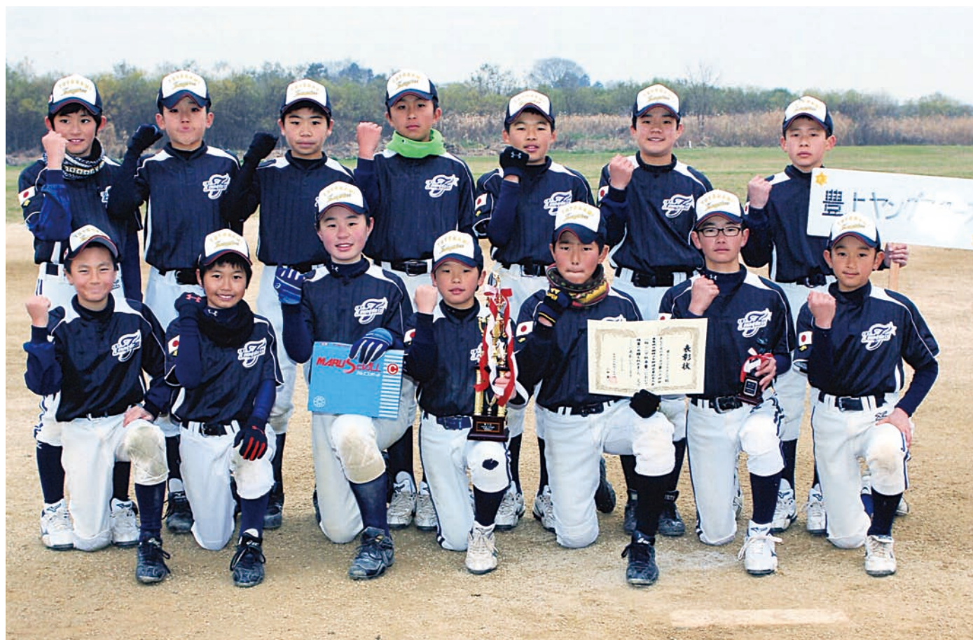
第三位 豊上ヤングスターズ -柏-