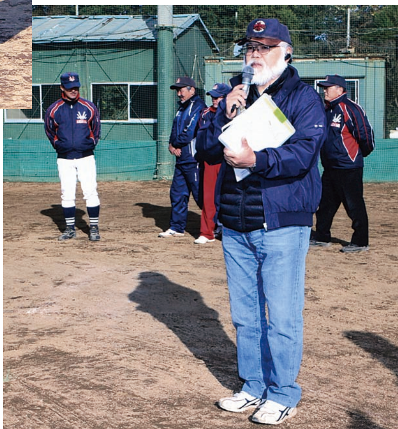
平田大会運営委員長