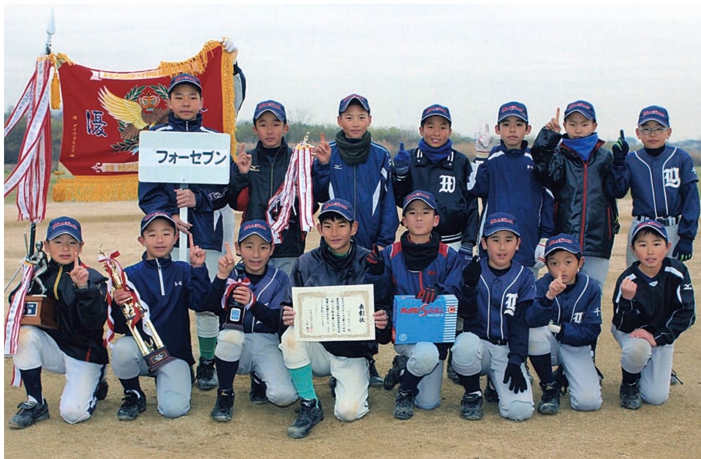
優勝 フォーセブン -柏-